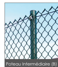
Poteau Intermédiaire (B)