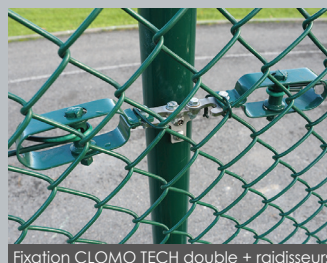
Fixation CLOMO TECH double + raisisseurs