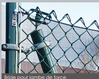
Bride pour jambe de force