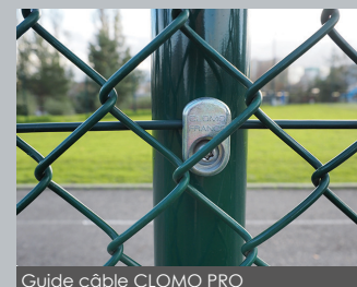
Guide câble CLOMO PRO