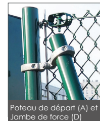
Poteau de départ (A) et Jambe de force (D)