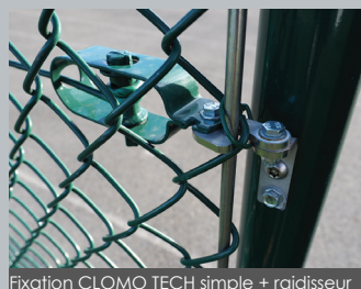
Fixation CLOMO TECH simple + raisisseur