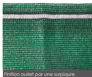
Finition ourlet par une surpiqûre