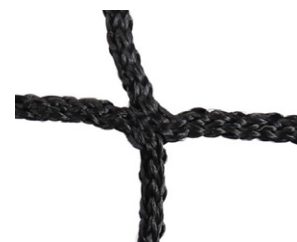
Filet sans nœud