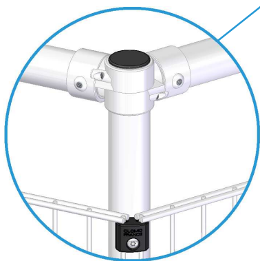
Angle orientable aluminium. Serrage par vis de pression.