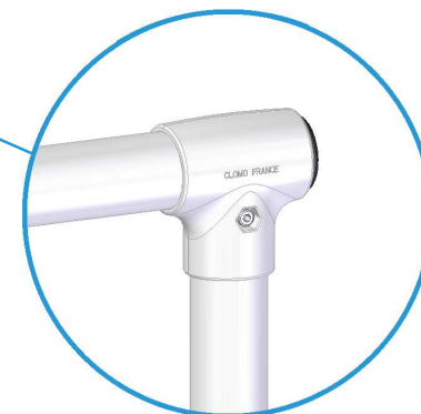
"TE" en zamak pour poteau de départ avec système anti-rotation. Serrage par vis métrique M10.