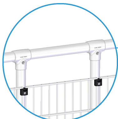
Lisse acier Ø60 ép. 2mm. Longueur 5m