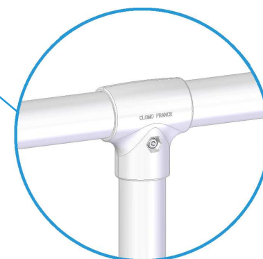
"TE" en zamak pour poteau intermédiaire, avec système anti-rotation. Serrage par vis métrique M10.